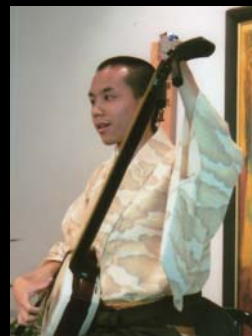
五錦雄互(津軽三味線)